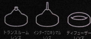
トランスルーミナールレンズ