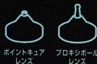
ポイントキュアレンズ